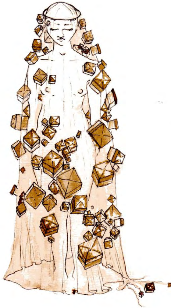
Estudo para veste pele – que despoja e recobre. (re)velar, caixas-memória-íntimo. Ano: 2012.