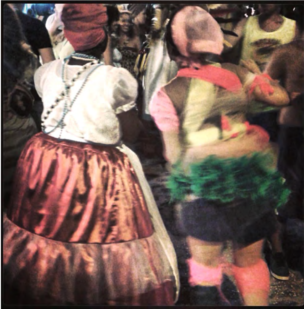
Duas senhoras no carnaval – Recife 2013