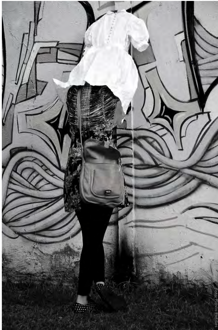
Fixação do vestido em parede no bairro da Tijuca no evento Wallpeople – 2012.