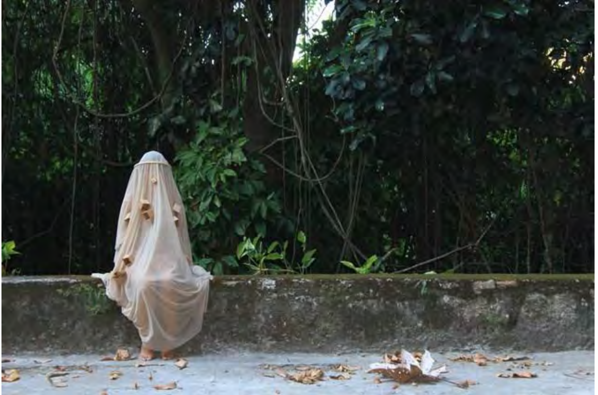
Experimento de domingo. Ano: 2014